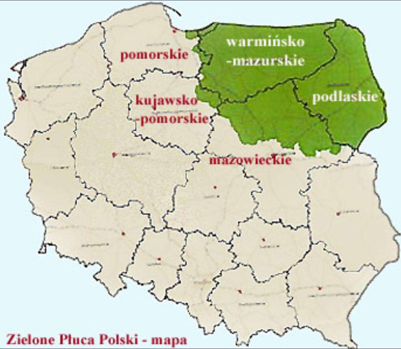
Zielone Płuca Polski - mapa